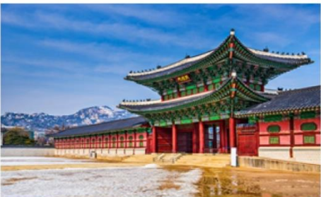
พระราชวังชางด็อกกุง