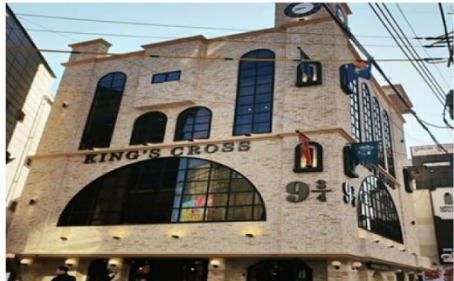
คาเฟ่แฮรี่พ็อตเตอร์