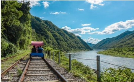
( Rail Bike )