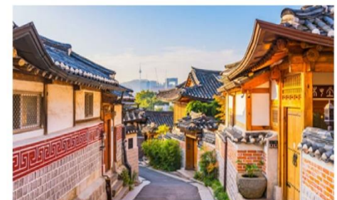
หมู่บ้านโบราณชุกซอน