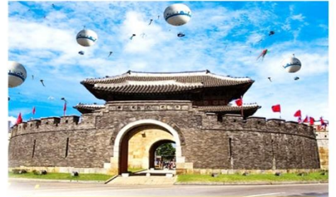
ชินบอลลูน