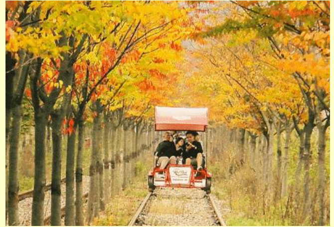
นำทุกท่านสัมผัสธรรมชาติและเปิดประสบการณ์

เที่ยง! บริการอาหารกลางวัน เมนูทักคาบิหรือไก่บาร์บีคิว ผัดชอสเกาหลี (อาหารเลี้ยงเชื้อโดยการนำไก่บาร์บีคิว มันหวาน กะหล่ำปลี ต้นกระเทียม ชอส และข้าว มาผัดรวมกันบนกระทะแบนสีดา คลุกเคล้าทุกอย่างให้เข้าที่ รับประทานคู่กับผักกาดเกาหลีและเครื่องเคียงต่างๆ)